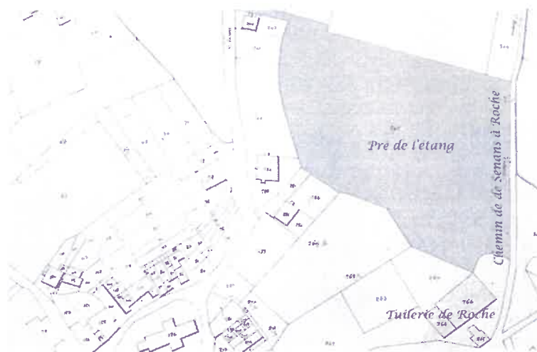
AD25 – Relevé cadastral de 1828

Un étang situé sous le village de Senans, muni d'une bonde (vieux français pilon) permettant de le vider pour en récupérer le poisson à la manière des étangs de Bresse, l'eau s'écoulant par le pré en aval de la digue vers la Loue et les vergers du seigneur.