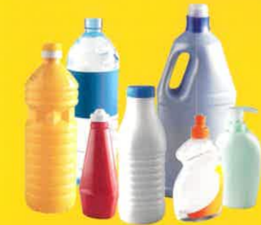
bouteilles / bidons / flacons