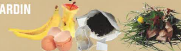
épluchures, coquilles d'œuf, filtres à café, thé, feuilles, fleurs...

MÉMO-TRI CHEZ VOUS, TOUS LES EMBALLAGES ET TOUS LES PAPIERS SE TRIENT