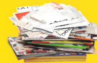
journaux / magazines prospectus / catalogues cahiers / feuilles enveloppes