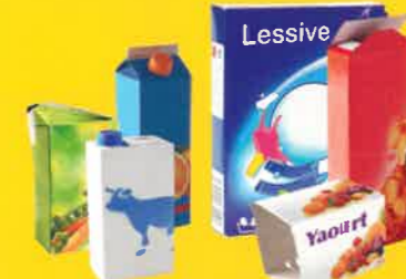
boîtes cartonnettes briques alimentaires

DÉCOUVREZ LE CENTRE DE TRI ! Que deviennent vos emballages une fois déposés dans votre bac de recyclage ? En quoi sont-ils recyclés ?