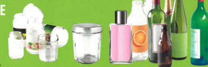
pots / bocaux / flacons / bouteilles