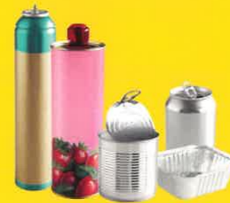
acier / aluminium