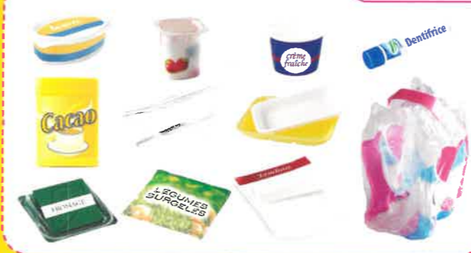
pots / barquettes / boîtes / sachets / films

i Merci de retirer les opercules et les films plastiques des pots (yaourts, crème...) et des barquettes (jambon, viande...)